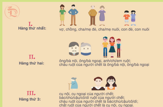
Ảnh minh họa: Nguồn ảnh Internet

c) Hàng thừa kế thứ ba gồm: cụ nội, cụ ngoại của người chết; bác ruột, chú ruột, cậu ruột, cô ruột, dì ruột của người chết; cháu ruột của người chết mà người chết là bác ruột, chú ruột, cậu ruột, cô ruột, dì ruột; chất ruột của người chết mà người chết là cụ nội, cụ ngoại.