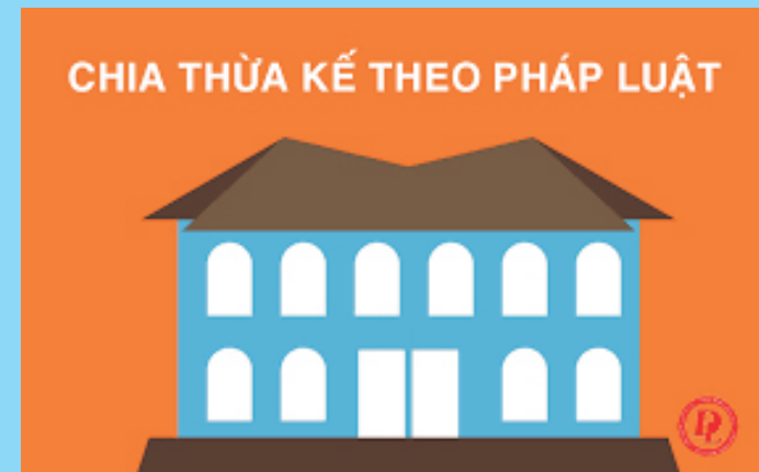
Ảnh minh họa: Nguồn ảnh Internet

2. Trường hợp vợ, chồng xin ly hôn mà chưa được hoặc đã được Tòa án cho ly hôn bằng bản án hoặc quyết định chưa có hiệu lực pháp luật, nếu một người chết thì người còn sống vẫn được thừa kế di sản.